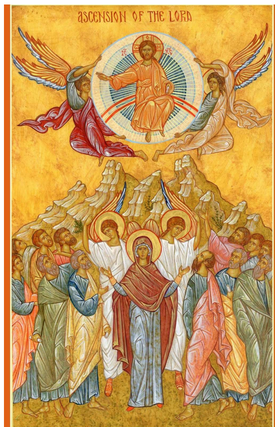
L'Ascension du Christ

« Et maintenant, glorifie-moi, Toi, Père, auprès de toi, de la gloire qu'avant que le monde ne fût, J'ai auprès de toi. » Le Christ révèle qu'Il n'est pas seulement né le jour de la Nativité. Ce jour-là, Il est né de la Vierge en tant qu'homme et au jour de l'Ascension, Il retrouve la place qu'Il avait avant son incarnation : Dieu auprès de Dieu. En dehors du temps, puis sur Terre, puis après l'Ascension, le Christ est et reste le même Dieu : « vrai Dieu de vrai Dieu ! Né du Père avant tous les siècles ! » (Credo) « Ceci est la vie éternelle : qu'ils te connaissent, Toi le seul véritable Dieu et celui que Tu as envoyé en ce monde, Jésus-Christ. » La vie éternelle est de connaître Dieu le Père et de savoir que le Christ est Dieu. C'est par le don du saint Esprit à la Pentecôte, qu'il nous sera donné la connaissance. L'Esprit est le chemin de la vie éternelle.