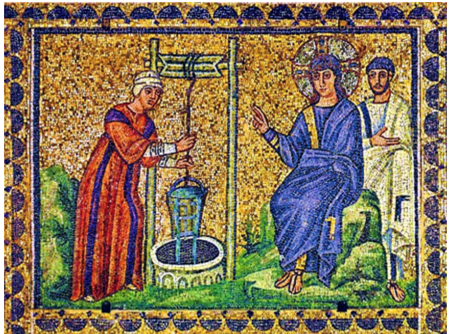
Mosaïque, église saint Apollinaire à Ravenne Italie