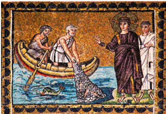
Mosaïque de l'église St Apollinaire le nouveau à Ravenne (Italie)

Nous avons mangé du poisson le jour de l'Annonciation car en Carême on prend du poisson les jours de fête (Annonciation, Rameaux). Nous en mangeons car c'est la nourriture que le Christ ressuscité a proposé aux Apôtres. Le poisson est donc un symbole de la Résurrection au milieu du Carême !