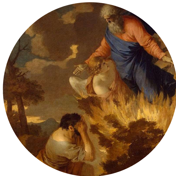
Le buisson ardent, Sébastien Bourdon, XVIIè siècle

Jésus Christ est celui qui a créé le ciel et la terre avec le Père et l'Esprit saint, qui a parlé à Moïse dans le désert et qui s'est fait homme. Il s'agit d'un seul et même Dieu.