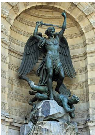
Saint Michel terrassant le Démon, fontaine Saint-Michel, Paris, Francisque Duret, 1860.

Et à partir de ce moment, le disciple prit chez lui Marie (Jean 19, 27).