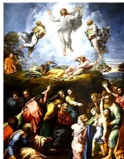
Transfiguration, Raphaël, 1516, musée du Vatican

Le Christ l'a choisi pour s'asseoir à ses côtés et mettre sa tête sur sa poitrine lors du Repas mystique, le Jeudi saint.