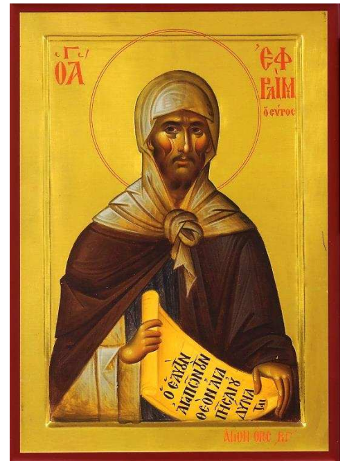
Saint Ephrem, doxologia.ro

Retrouve la prière de saint Ephrem et son explication dans les pages 1 à 15 !