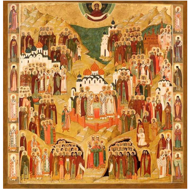
icône de la fête de tous les saints

Oui bien sûr. Par exemple, sainte Parascève a été priée par les fidèles comme une sainte pendant une génération, sans être encore canonisée. Les fidèles sentent cela dans leur cœur par le saint Esprit qui leur montre la sainteté de tel ou telle. Un jour, les évêques de Roumanie, ont décidé que sainte Parascève, déjà considérée comme une sainte par le peuple depuis 100 ans, serait canonisée et serait inscrite dans le calendrier.