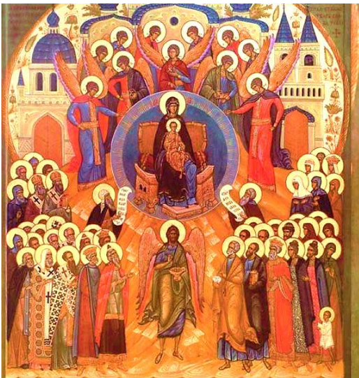
icône de la fête de tous les saints

Nous pouvons dire à Dieu "révèle-moi le nombre de tes saints". Nous aurons la révélation du nombre des saints au jugement dernier, dans le Royaume.