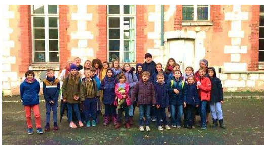
Les enfants de la paroisse, fils et filles de Dieu, frères et sœurs du Christ