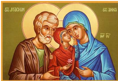
Joachim et Anne, les parents de Marie, les grands parents du Christ

Joseph n'est pas le père du Christ mais son père adoptif . Il va l'accompagner dans toutes les étapes de son enfance comme ici le jour de la Sainte Rencontre, fêtée le 2 février, jour où le Christ est présenté au temple.